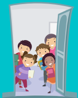
Accueil du matin