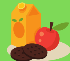
Après la classe