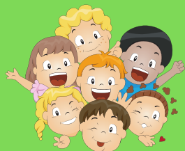
Ateliers du mercredi