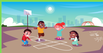
activités sur la pause de midi