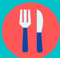
Commander ou annuler un repas