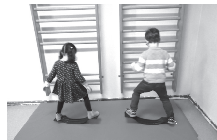
Activité autour de l'équilibre.