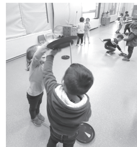
Le fameux tour des assiettes.

Exécuter des figures, rester en équilibre sur un engin, développer la latéralisation, intégrer le schéma corporel, trouver le sens de l'équilibre, améliorer son adresse, sa souplesse, l'ambidextrie, tout