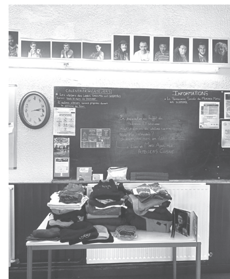
Résultat de la collecte de décembre 2020.

La Rencontre, située rue Pelletier, est un lieu d'accueil de jour pour personnes en situation d'errance ou de grande précarité, géré par le Foyer Notre-Dame des Sans-Abri. Elle accueille environ 40 personnes par jour.