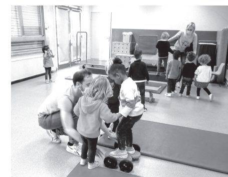
Rouler en équilibre, quel cirque !

Un programme complet pour nos apprentis-clowns !